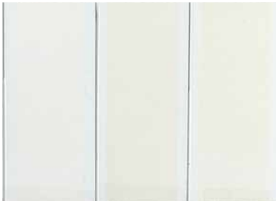
HL5500 未処理透明PC板 他社製品A ヘッドランプリペアキット