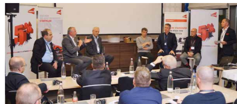
Podiumsdiskussion beim Kickoff 2020 in Mainz