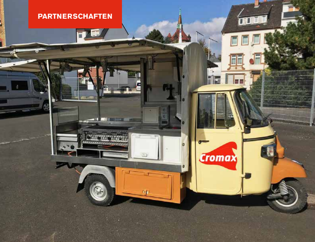
Der besondere Service von Cromax – Currywurst frisch aus dem Bratmobil