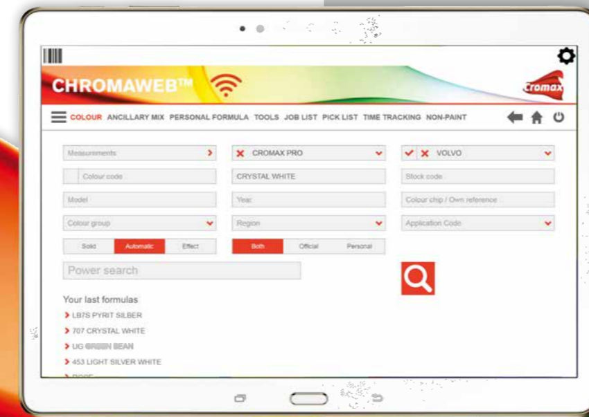
Die neue ChromaWeb App in der Ansicht auf einem Tablet