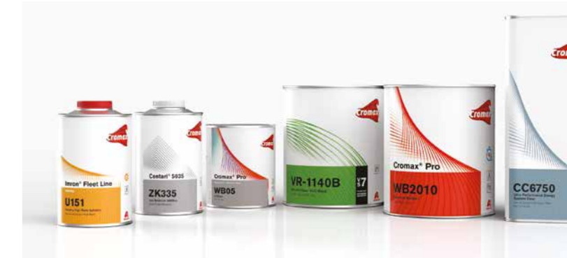
Mehr Klarheit auf den ersten Blick. Das neue Etikettendesign von Cromax erleichtert die Identifikation der einzelnen Produkte.