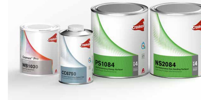
Übersichtlich und gut lesbar – die Neugestaltung der Etiketten nimmt auch die Hinweise der Anwender auf.

Acht unterschiedliche Colorcodes kennzeichnen die Produktgruppen – vom Mischlack über Füller und Klarlacke bis zur Verdünnung. Auch die Produktfamilie lässt sich dank besonders großer Icons für Nutzfahrzeuge und Industrie besser unterscheiden. Symbole, die konkrete Hinweise auf die korrekte Handhabung der Gebinde geben, erscheinen rechts neben dem Technologiestreifen. Dadurch sollen Irrtümer ausgeschlossen werden – und somit die Effizienz und Produktivität in der Werkstatt weiter steigen. Die neuen Etiketten fließen ab sofort in die Produktion ein.